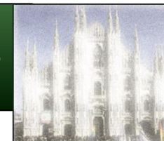
Pharm Tech GazzaLaB

GMP, QbD, QRM, PQS, QP, ICH Q8-Q10: un labirinto di regole o un'armonia di filari in un campo fertile per il miglioramento della qualità?